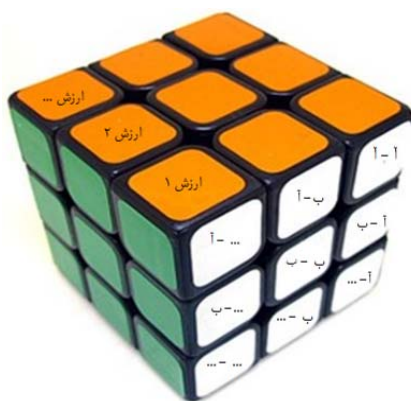
شکل (۱): چارچوب سه وجهی برنامه‌ریزی متوازن در حکومت اسلامی

از آنجایی که هر برنامه باید بر پایه ارزشی برخاسته از پارادایم ذهنی برنامه‌ریزان آن باشد، نگارنده بُعد سوم را نیز برای این ارزش‌ها پیشنهاد می‌کند که متغیرهای ارزشی برنامه نامیده می‌شود. با شناسایی و ورود این بُعد به برنامه‌ریزی "چارچوبی سه وجهی برای برنامه‌ریزی متوازن در حکومت اسلامی" حاصل می‌شود که در شکل (۱) دیده می‌شود. برای ملموس شدن این روش برنامه‌ریزی به کمک خبرگان فعالیت‌های زیر انجام و مدلی ۶*۶*۶ ارائه شد. در مرحله اول اقدام به شناسایی بخش‌ها یا ابعاد مختلف برنامه‌ای با نظر خبرگان شد. بخش‌های اصلی شناسایی شد؛ ۱- فرهنگی، ۲- اقتصادی، ۳- اجتماعی، ۴- علمی، ۵- آموزشی، ۶- صنعتی، ۷- سیاسی، ۸- حقوقی، ۹- قضایی، ۱۰- نظامی، ۱۱- امنیتی، ۱۲- انتظامی، ۱۳- فناوری، ۱۴- بهداشتی، ۱۵- محیط زیستی، ۱۶- درمانی، ۱۷- پرورشی، ۱۸- کشاورزی، ۱۹- انرژی، ۲۰- ارتباطات و ۲۱- مسکن و شهرسازی