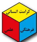
شکل (۳): مکعب تدوین برنامه با توجه به دو بعد فرهنگی- علمی و ارزش کرامت انسانی

برای تدوین برنامه‌های کلان در هر بخش یا بُعد برنامه‌ای با در نظر گرفتن دیگر ابعاد و ارزش‌های مورد تأکید، مکعب مربوط تکمیل خواهد شد. برای مثال برای تدوین برنامه در بُعد فرهنگ همه ابعاد از جمله بُعد علمی را در نظر گرفته و با تأکید بر ارزش‌های ۶ گانه برنامه را تدوین خواهیم کرد. یک نمونه این مکعب‌های کوچک برنامه در شکل ۳ آمده‌است.